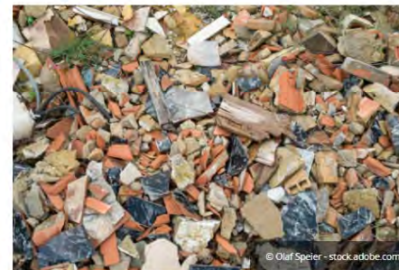
Unsortiertes Gemisch von Bauschutt